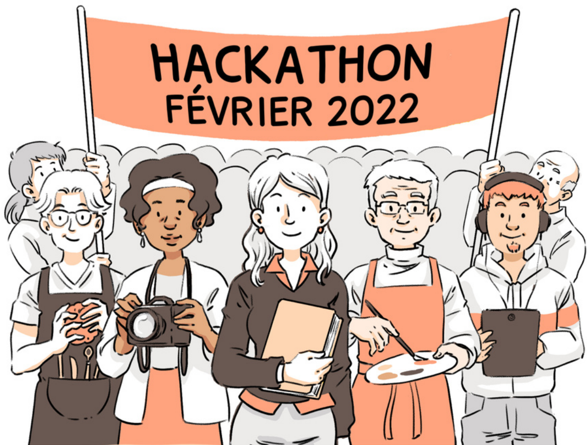
Illustration : Miya